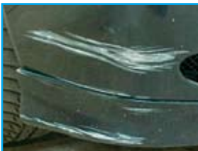
Niet acceptabel, door de lak heen