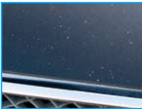
Acceptabel bij meer dan 100.000 km