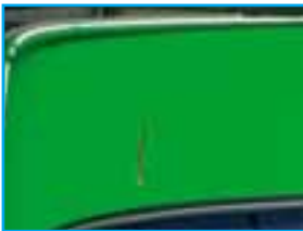
Acceptabel op bedrijfswagen